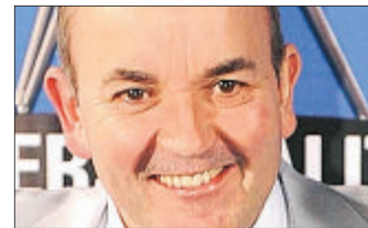
Favorit bei der Dart-WM: der Brite Phil Taylor